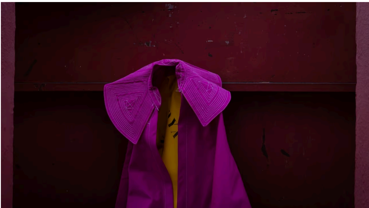
"La gran mentira de la muerte", Wu Tsang, 2024.