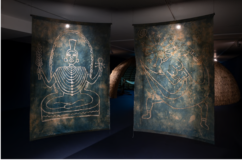
Omo Elu, 2024, Museo Nacional Thyssen-Bornemisza, Madrid.