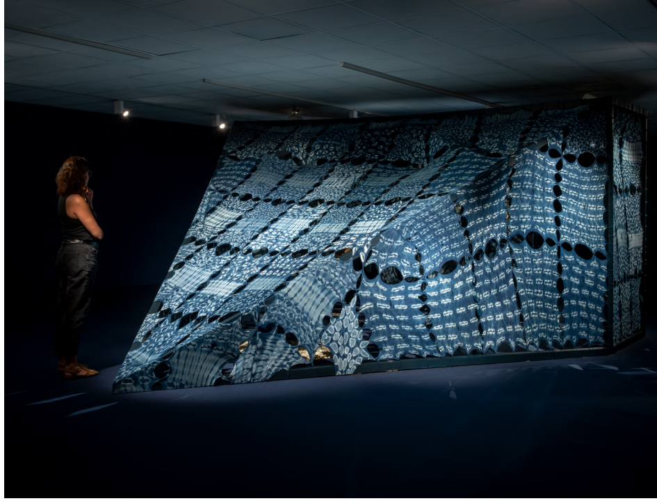
OMI: Templo de Yemoja, 2024, Museo Nacional Thyssen Bornemisza, Madrid.