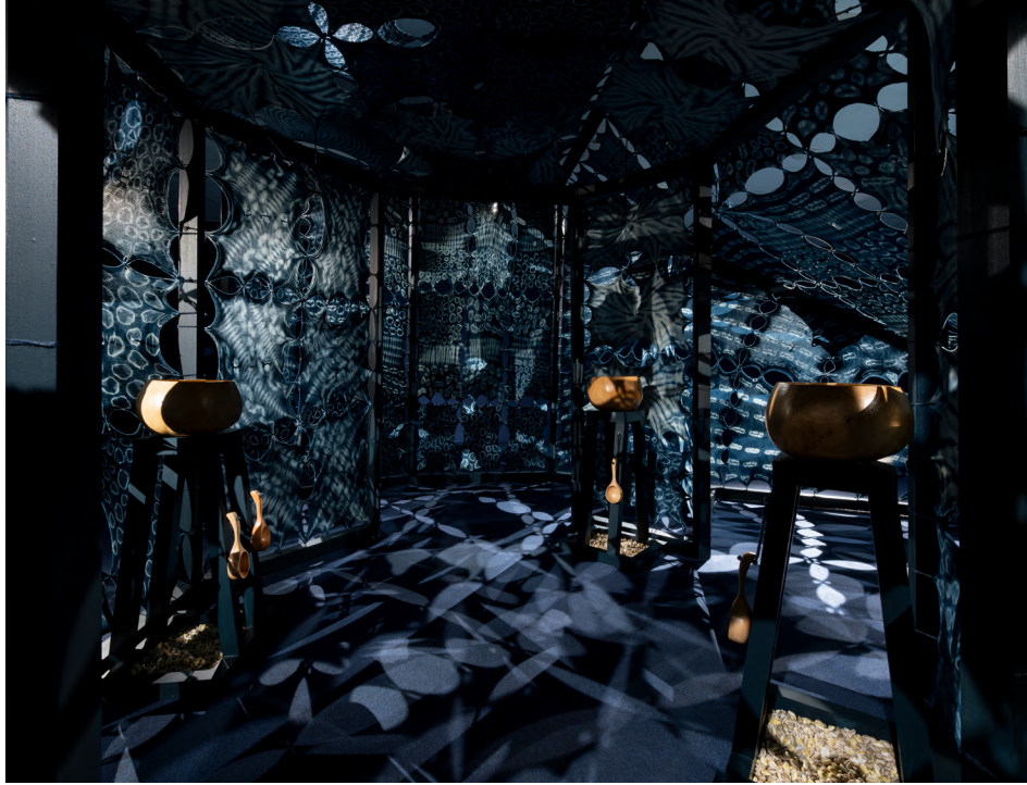
OMI: Templo de Yemoja, 2024, Museo Nacional Thyssen Bornemisza, Madrid.

Yussef Agbo-Ola nació en Newport News, Estados Unidos, en 1990. Vive y trabaja en Londres, Reino Unido, Ibadán (Nigeria), y en la selva amazónica.