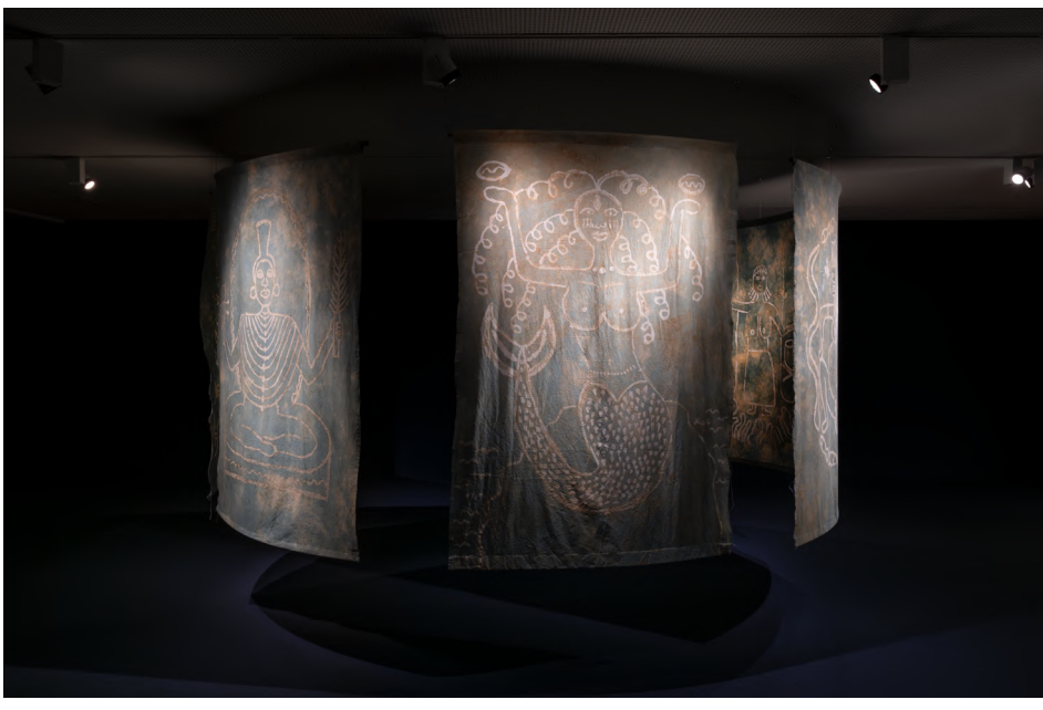
Omo Elu, 2024, Museo Nacional Thyssen-Bornemisza, Madrid.