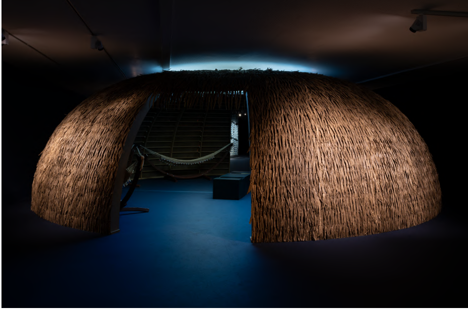
Des/astres , 2024, Museo Nacional Thyssen-Bornemisza, Madrid.

del Amazonas. Al combinar la investigación científica con las tradiciones sagradas, Des/astres revela un rico tapiz de conocimientos que abarca la arqueología, la astrofísica, la mitología, el misticismo y las cosmologías tradicionales. Ofrece una exploración profunda de las perspectivas cosmológicas, tanto modernas como ancestrales, y fomenta la reflexión sobre nuestra influencia en el reino terrestre y el celeste.