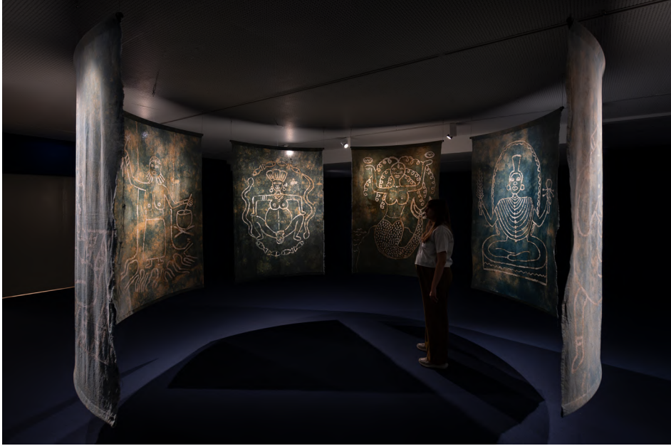
Omo Elu, 2024, Museo Nacional Thyssen-Bornemisza, Madrid.