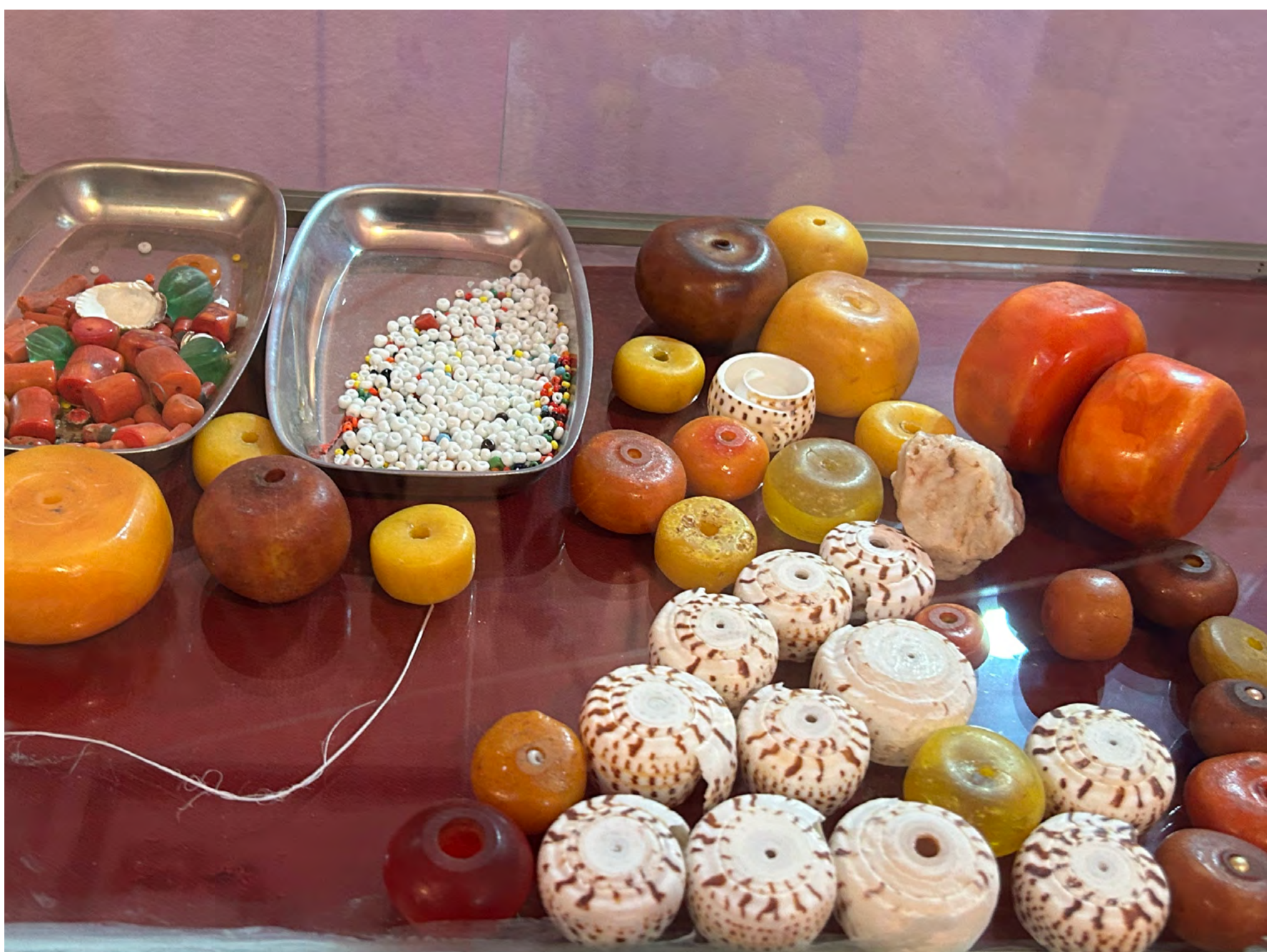
Documentación de la investigación de campo de Tarek Atoui en la región del Atlas, 2023-4.