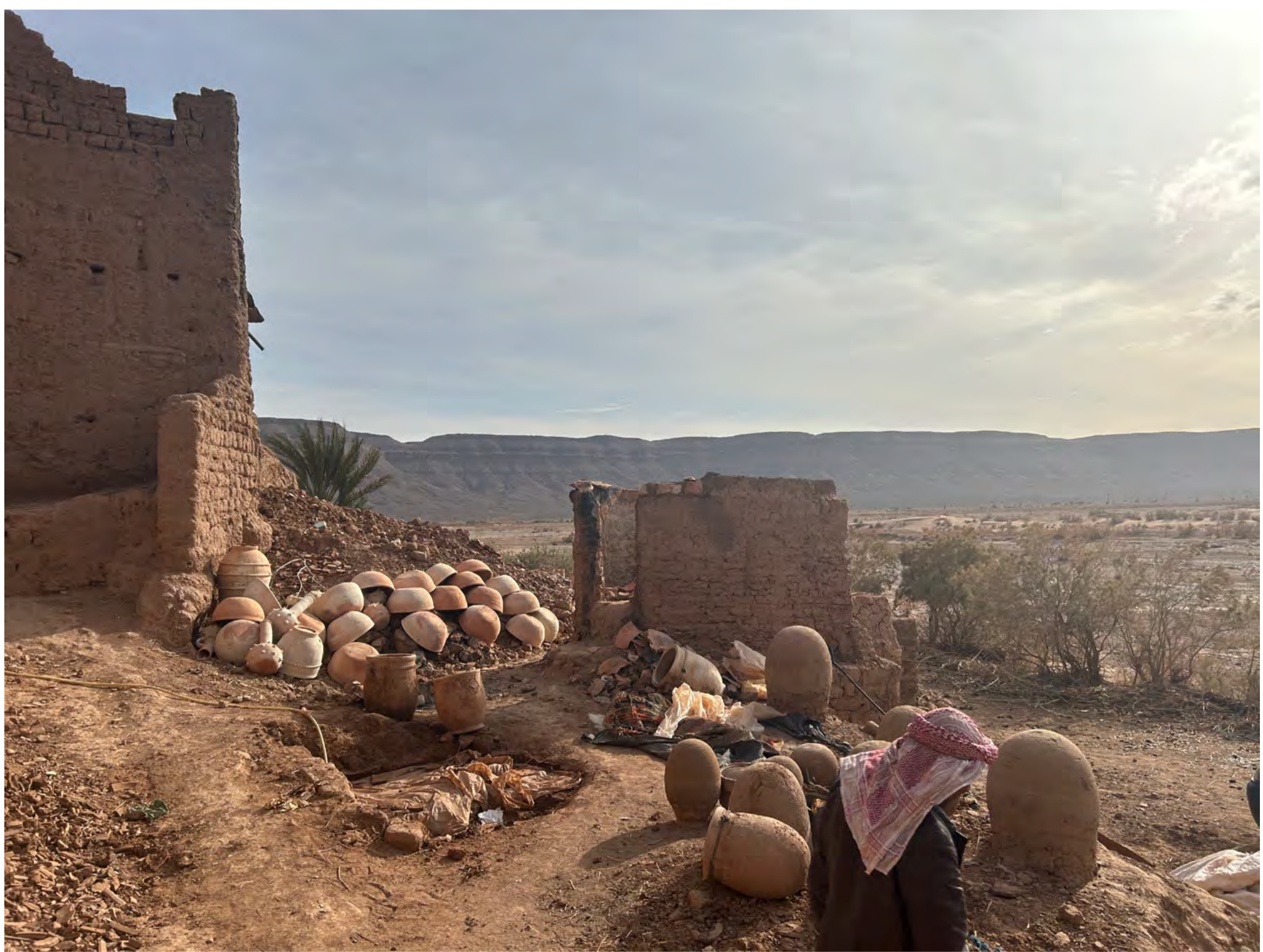
Documentación de la investigación de campo de Tarek Atoui en la región del Atlas, 2023-4.