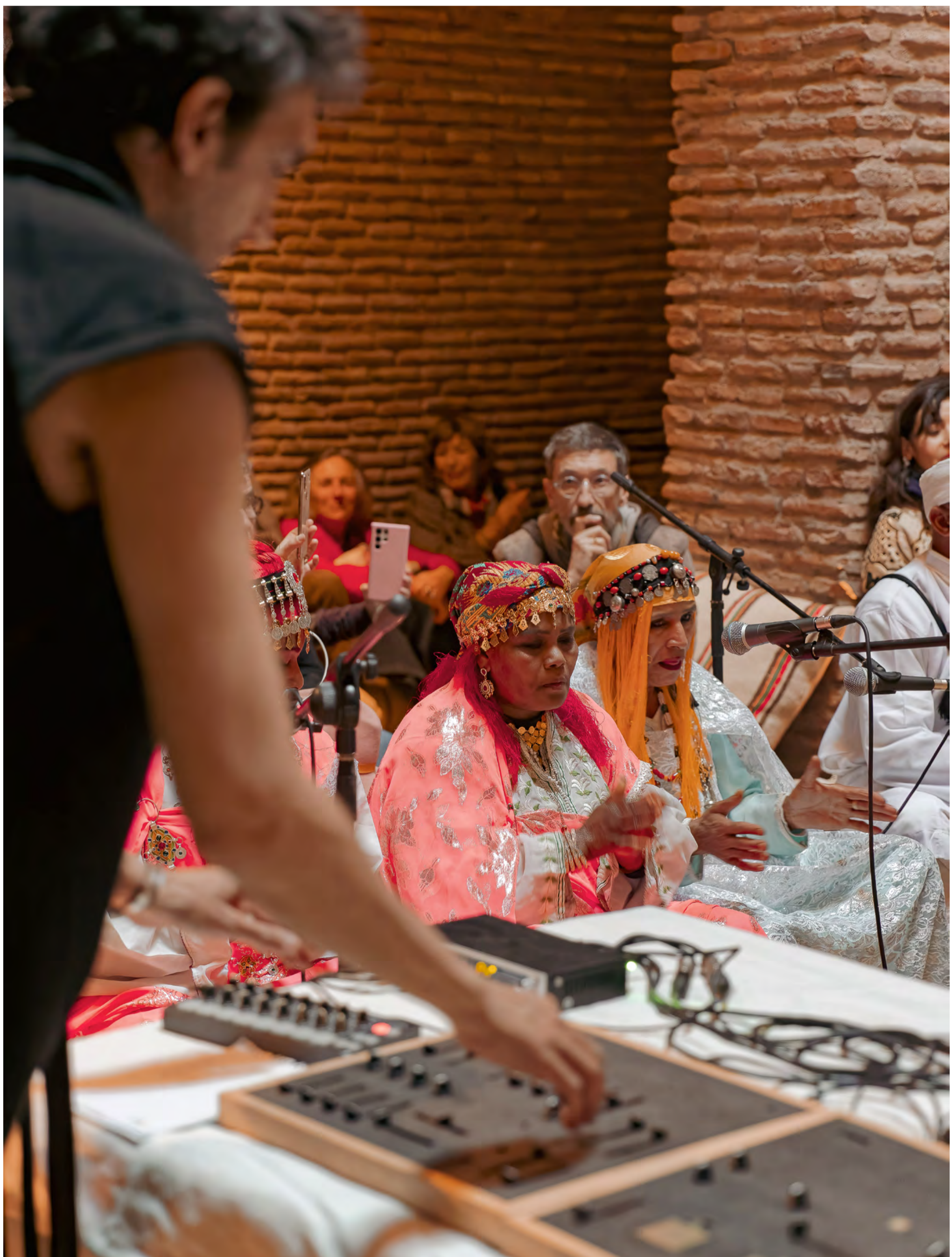
Forgotten Tales Through Time, Marrakech, 2025.