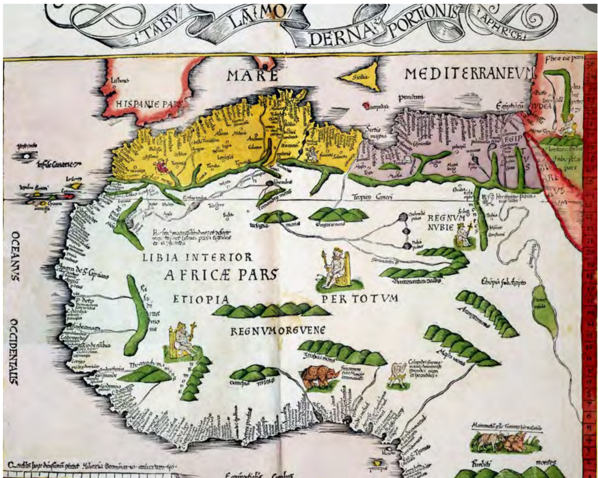
Mapa del norte y oeste de África, publicado en Estrasburgo en 1522.

atravesar amplias e inhóspitas franjas de tierra. Desde el océano Atlántico, pasando el río Nilo y hasta el golfo Pérsico y las orillas del Éufrates, y desde las orillas del Mediterráneo hasta las fronteras meridionales del Sáhara, este inmenso territorio formó parte de un sistema mundial más extenso, de una red de intercambio en torno al mundo musulmán que conectaba el océano Índico, China y Europa.